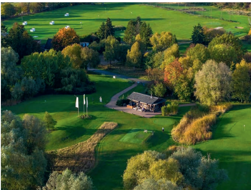
Tee 1 an der ‚Almhütte‘: Der Schwarze Course im Golf Lounge Resort.

Also, Golf darf gern knackiger werden, kürzer und cooler. Wie im Golf Lounge Resort, das zu einer ziemlich einmaligen Symbiose von Freizeit, Event und Golf -Location gewachsen ist und wo sich die eingesparte Zeit entspannt und genussvoll in der Elb Lodge oder auf der umlaufenden Terrasse verbringen lässt. ■