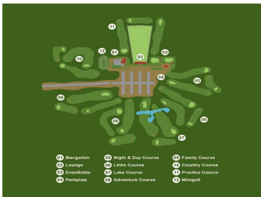
Flotter Dreier mal sechs: Peter Mercks Planspiel ‚Golf Lounge Country‘ ist das Konzept für einen modernen Golfplatz, der alle Zeit- und Aufwandsbedürfnisse berücksichtigt.

Dafür ist der Schwarze wie die weltweiten Brüder und Schwestern ein kompletter Golfplatz mit sämtlichen Features: mit Teichen und Bunkerkomplexen und kleinen, interessant ondulierten Grüns, die akkurate Annäherungen erfordern. Die Optik ist bestechend und täuscht einen Schwierigkeitsgrad vor, der im Spiel dann doch lösbare Aufgaben beschert – allein schon, weil nicht mit den langen ‚Ste-