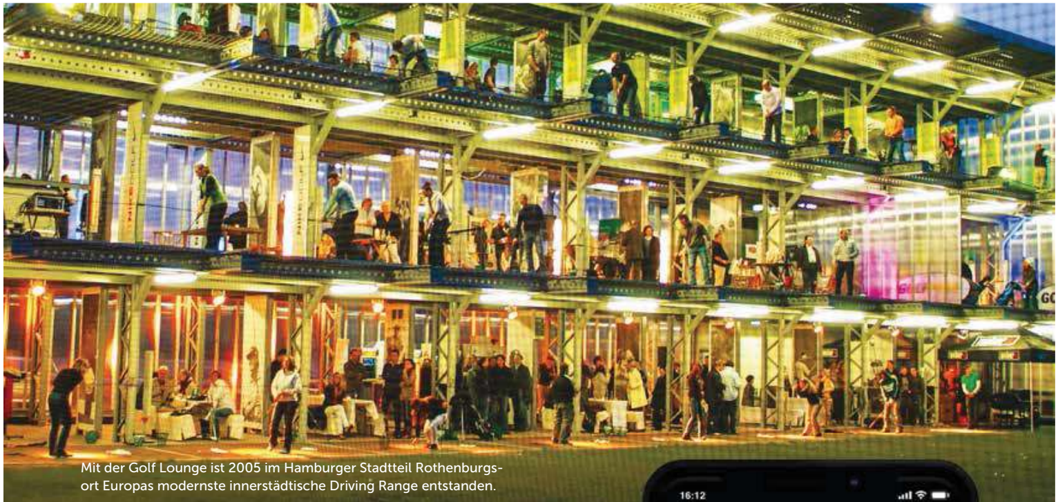
Mit der Golf Lounge ist 2005 im Hamburger Stadtteil Rothenburgsort Europas modernste innerstädtische Driving Range entstanden.