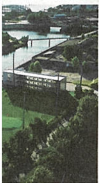
Schlagfertig: Auf drei Etagen kann man beim „Pay per Ball“ (50 bzw. 100 Bälle für 8 Euro) den Schwung, auf dem „Pitch & Putt Platz“ das Einlochen üben – und zwischendurch beim Drink entspannen

ussieht, hat Merck die Anlage „Pirates Golf“ getauft. Klar, lass Merck daraus eine Attraktion für die ganze Familie machen will. Demnächst soll ein Flügel im Sand stehen und abends Klaviermusik erklingen. Auch „Movie Nights“ kann er Mann aus Groß Flottbek sich vorstellen, dazu will er eine Leinwand vor die Driving Range spannen – natürlich wäre es während der Vorführung Abschlagverbot.